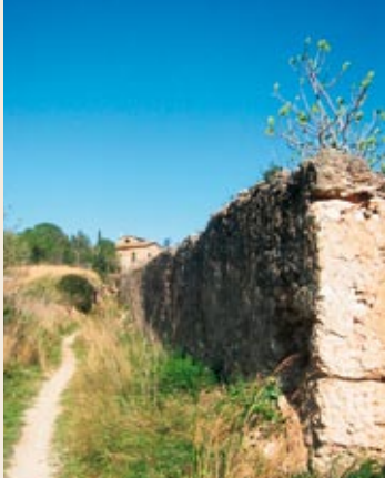
La Granja de Doldellops