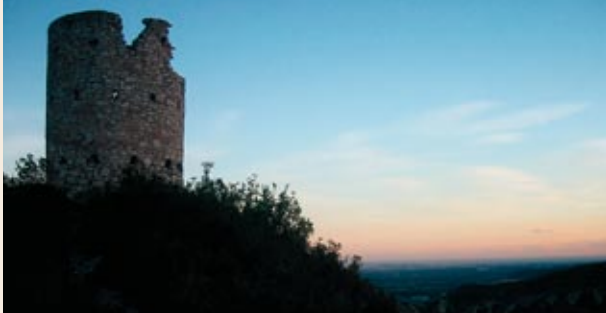
La torre del Petrol

cingle de les Roques Caigudes, que obliga el Francolí a retorçar-se i formar l'estret de la Riba. Davant, a un cop de pedra, tenim el poble. Passem a tocar d'uns curiosos marges i voltrem cap al serrat del Querol, al sud, per anar a buscar el pas de grau. Ara tenim a sota la boca sud del túnel de la Riba per on circula el tren d'alta velocitat. Comencem a descendir més fort. Cal estar atents a les fites de pedra que ens van guiant.