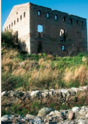
Molí del Pont de Goi