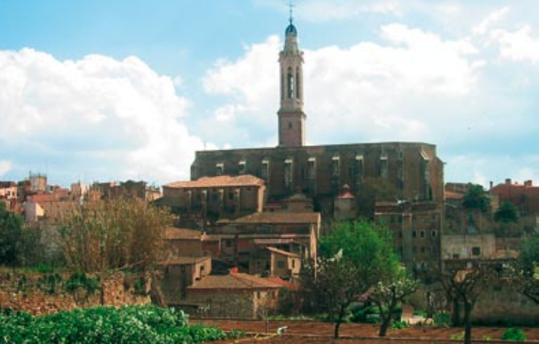
Valls. Església arxiprestal de Sant Joan