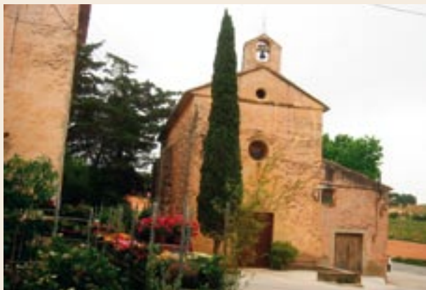
Església de Vilardida

Anem trobant alguns entradors a les parades. Tenim el traçat de l'antic camí a mà dreta, ara convertit en rasa. Comencem a veure els primers camps de cirerers. Enfront sobresurt la torre del mas d'Infants i, a l'esquerra, el santuari de Montserrat i Montferri, al peu de la serra homònima, coronada per la torre del Moro.