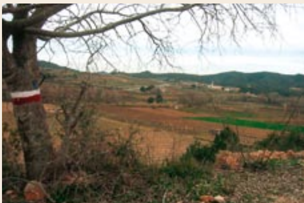
Senyal del GR 172-1, que seguirem fins a Bràfim

Bifurcació revessa, d'accés al mas d'Infants, que hem deixat a sota; l'espessa vegetació ens l'amaga una mica. A la dreta, un altre sender també mena a la torre. Al cap de cent metres abandonem una altra pista que baixa cap als conreus. Pugem una mica per situar-nos al pla superior.