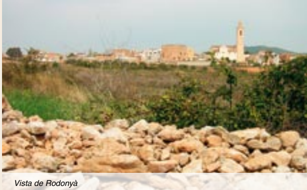
Vista de Rodonyà

quadrada i les parets estan rematades amb una filera de merlets, que el fan més atractiu.