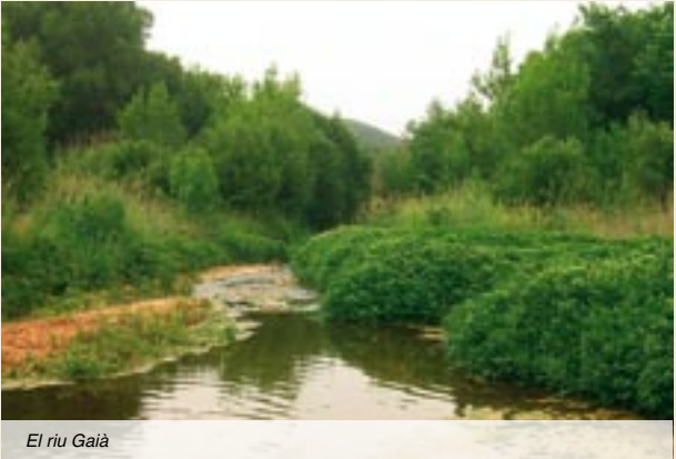
El riu Gaià

Del costat de la tanca del fossar en parteix el camí asfaltat de Montferri. Nosaltres continuem pel camí del Trull, en direcció sud-est, que davalla pel vessant esquerre del barranc. Els primers metres estan asfaltats, però aviat el camí s'estreny i la vegetació ens envaeix ja que és poc transitat.