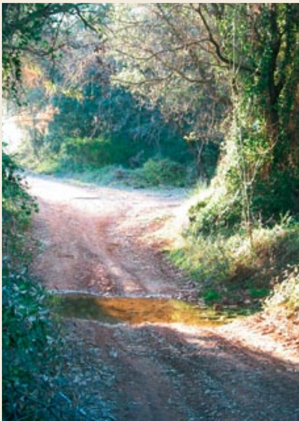
Torrent de les Pinetelles