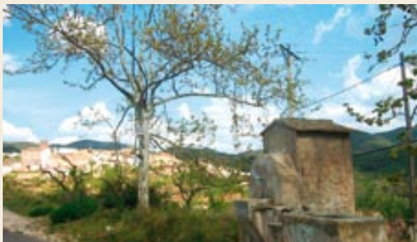
Font a l'entrada de les Pobles per la carretera

Si volem, podem entrar al poble seguint el camí del Celler, a la dreta, que creua la carretera i porta fins al centre. A pocs metres trobem el xalet de ca la Roser i, seguidament, en una gran esplanada, la bàscula. Si esguardem enrere, per damunt de les cases de baix de les Pobles, veurem com treu el nas el campanar de l'Albà. Passem per darrere les escoles; a l'altre costat tenim un corral d'ovelles de nova construcció.