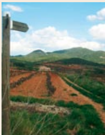
Cal Magre i la muntanya de l'Albà

Torrent de Rubió (340 m). Saltem un graó i passem a gual el corrent d'aigua. Superem el graó de l'altra riba i continuem pel sender.