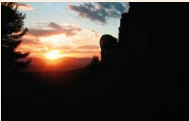
Posta de sol a l'Albà Vell