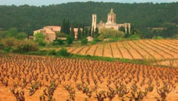
Part posterior del monestir de Santes Creus