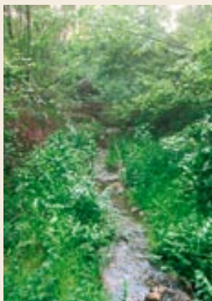
Torrent de Rubió