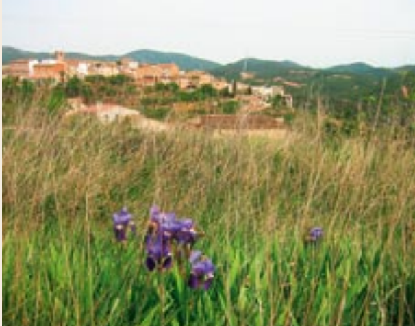
Panoràmica de les Pobles