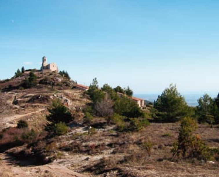
El poble de Mont-ral