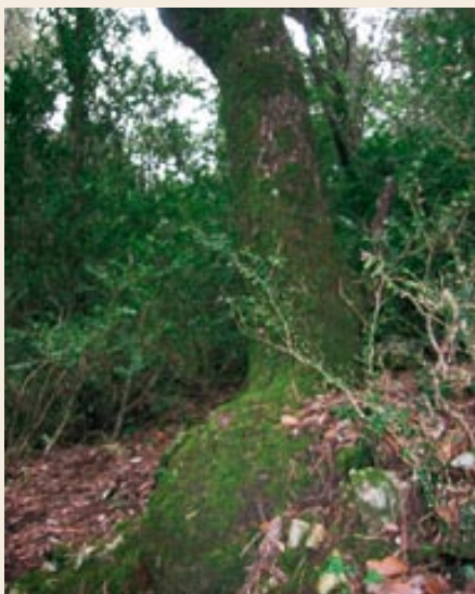
A través d'un bosc ombrívol