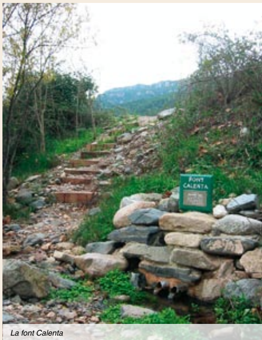
La font Calenta

Comença una forta baixada. El camí, intel·ligentment, s'adapta al relleu del terreny: fa ziga-zagues i evita els forts desnivells que els animals carregats amb les sàrries no podien superar. Siguem, doncs, intel·ligents i evitem agafar les dreces que, més que senders, semblen escórrecs d'aigua i l'únic que guanyarem serà malmetre el camí o, en el pitjor dels casos, prendre mal.