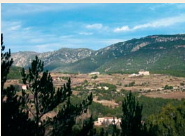
Els masos de la Cadeneta