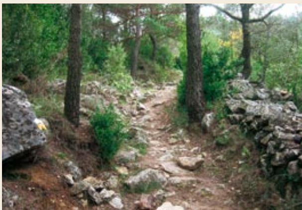
Senyals de PR

(Rafael López-Monné. A peu per les comarques de Tarragona. Vol. 1, Col·lecció de Ferradura, Arola Editors, 2005.)