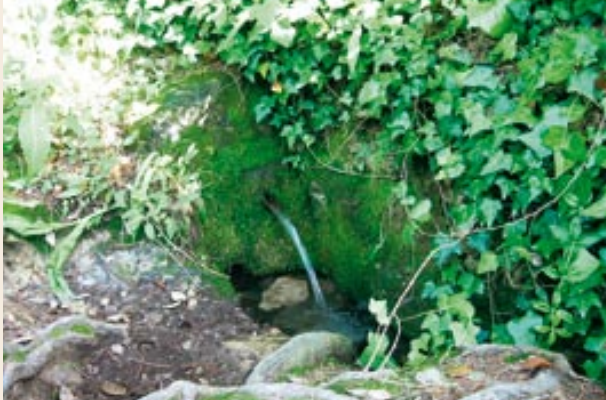
Font de l'Escopeta