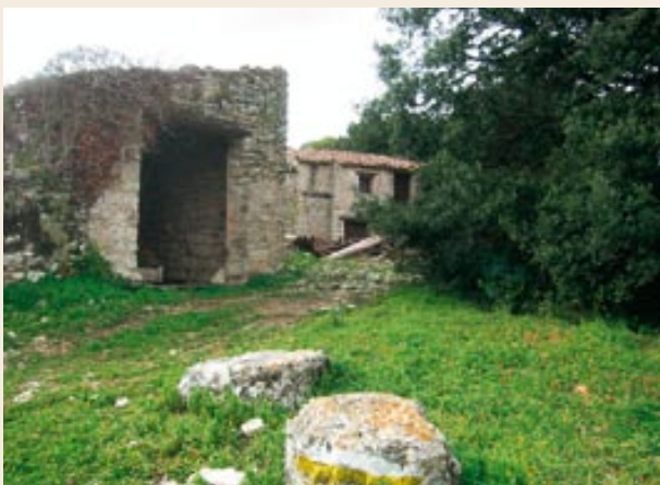
Mas d'en Verd