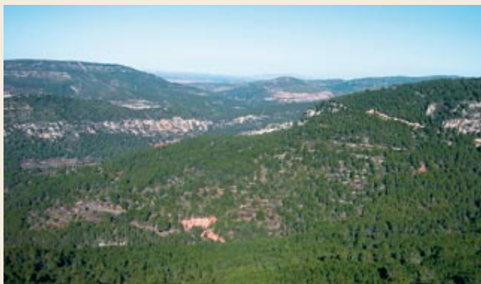
La vall del Gaià

Cadena. Als laterals del camí trobem dues bigues de ferro de color verd que subjecten una cadena. Tot i que gairebé mai no la trobareu tancada, cal parar atenció, si aneu en bicicleta,