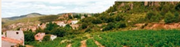
Panoràmica de Querol

Gir de 180° (632 m). El camí gira 180° prenent la direcció nord-oest. Passa arrapat per sota el cingle del coster del Moneu. Continuem pujant i ens anem trobant una magnífica panoràmica de la serra de Miramar i bona part de l'Alt Camp,