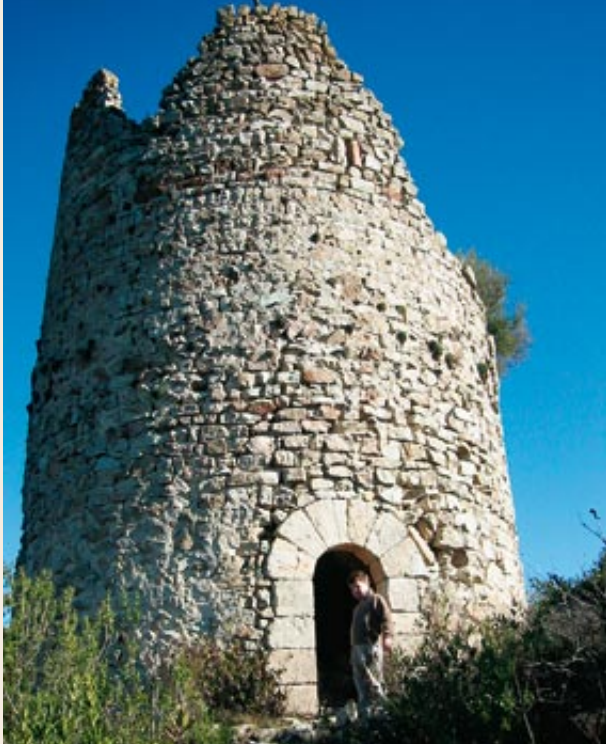
Porta adovellada d'accés a la torre