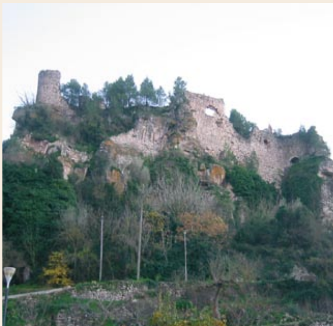
El castell de Querol

Querol (565 m). Deixem la carretera just a l'entrada del poble per girar pel carrer de la dreta cap al safareig públic. Podem continuar cap a la dreta fins a l'àrea de lleure de la font de Querol o bé seguir a l'esquerra pel carrer d'Andorra. Arribarem a la plaça de Sant Sebastià, des d'on podrem fer un tomb fins a la part alta del poble, on hi ha les restes del castell de Querol i l'església de Santa Maria. Es tracta d'un petit edifici construït en èpoques diverses, d'una nau, volta seguida d'arc apuntat i campanar quadrat amb finestres de punt rodó i acabat en una coberta piramidal.