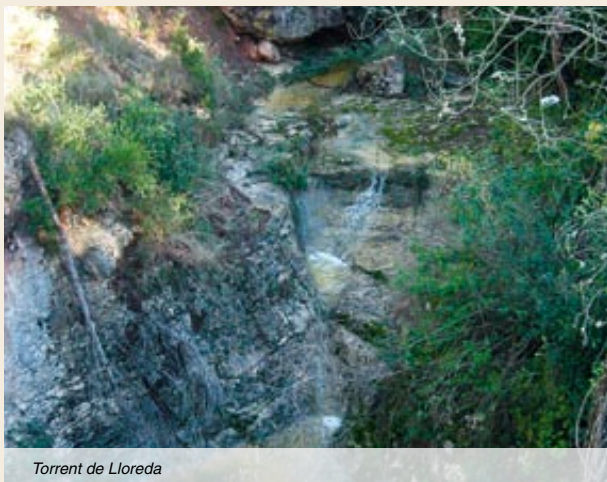
Torrent de Lloreda

amb la vall del Gaià als nostres peus; en sobresurt el mas de cal Regalat, que presideix aquest eixamplament de la vall. Impressiona també la imatge de la torre del castell de Pinyana, per on passarem de retorn a Querol.