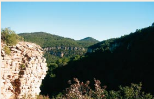
El con de Montagut des de l'ermita de Sant Salvador