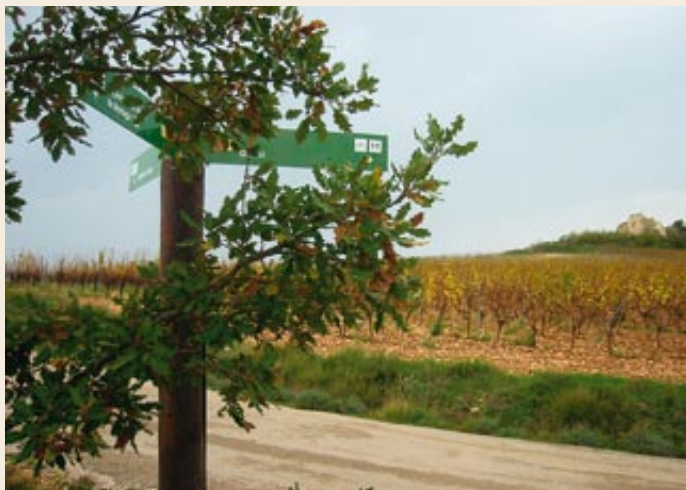
Coll de Montagut. Al fons, cal Rovira

Parada de ceps. Fem cap a una parada de ceps emparrats que sembla que ens vulguin barrar el pas. Hem de seguir les roderes dels cotxes cap al nord-est i vorejar la parada uns 70 metres escassos, passats els quals creuarem la parada entre les