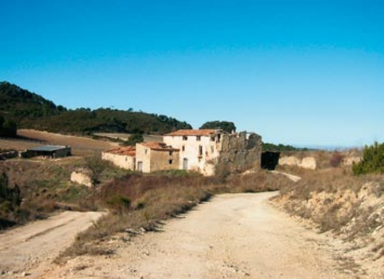
Masia de cal Boada