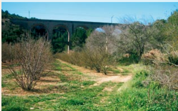
Los Set Ponts

Cañada de Valls al Vendrell. La tomamos por la izquierda, hacia Vilabella. Hacia la derecha va a Salomó, que dista unos 3,5 kilómetros de aquí. Antes, sin embargo, se encuentra la bifurcación del camino de la Polla-rossa y Montferri.