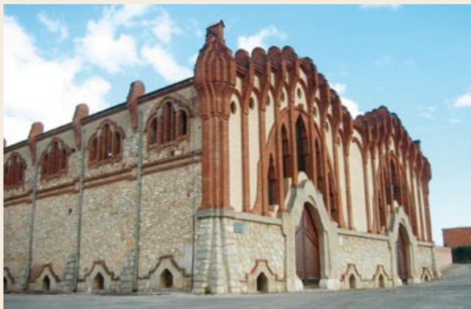
Cooperativa modernista de Nulles

Cooperativa de Nulles. Llegamos por la parte trasera. Continuamos hasta encontrar la carretera de acceso que nos llevará al centro del pueblo y al final de este recorrido.