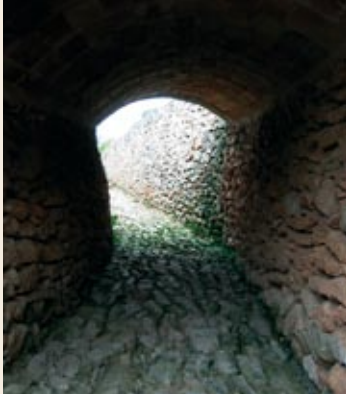
Rasa de desguàs del camí