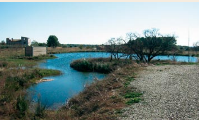
Els aiguamolls del Pla

Aiguamolls (323 m). Deixem el camí més fressat i decanatem a la dreta cap a la caseta d'observació d'aus que es troba a ran de la llacuna. Per poder observar els ocells és important que no feu soroll. Els aiguamolls del Pla han sorgit de les aigües provinents de la depuradora d'aigües residuals del poble i del polígon. Són únics a la comarca de l'Alt Camp i han esdevingut punt de parada de nombrosos ocells (destaquen importants espècies protegides).