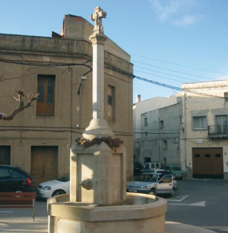
Font de la plaça de Jacint Verdaguer o del Soldevila