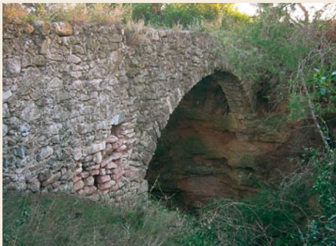
Pont del Diabre o del Moro al torrent dels Masos