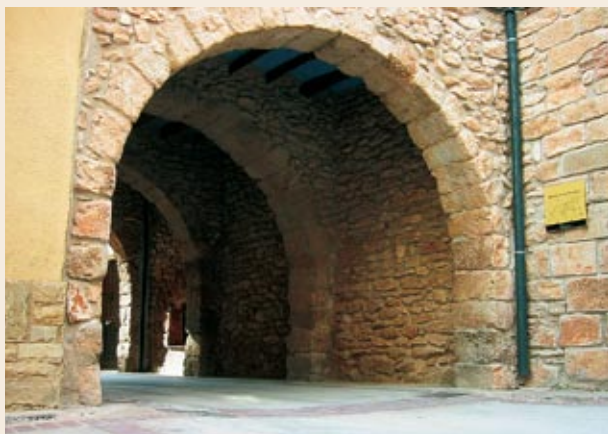
Portal del carrer de la Trinitat del Pla, a prop de l'Ajuntament

Plaça de la Vila (388 m), presidida per l'edifici de l'Ajuntament. Final de l'excursió.