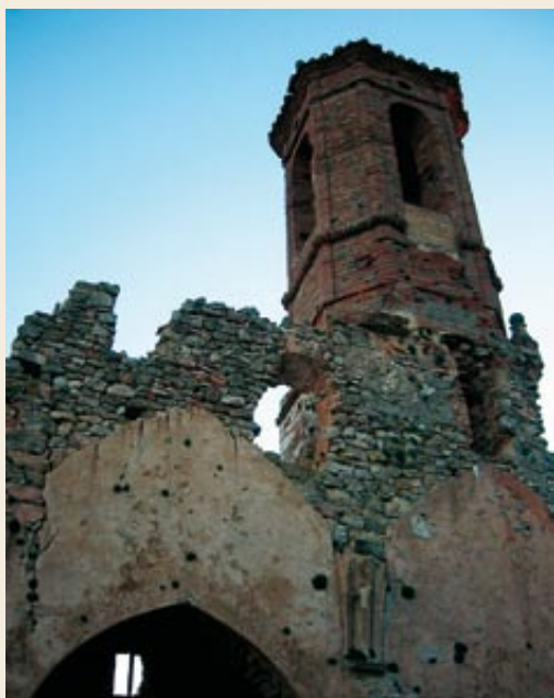
Restes de l'església de Sant Cristòfol

Selma (736 m). És un topònim d'origen aràbic. El 1950 el poble ja estava abandonat, malgrat haver-se mantingut com a capital econòmica de les masies de l'entorn fins al començament del segle XX. En causaren la ruïna la fil·loxera i la construcció de la carretera fins al Pla de Manlleu. Es conserven restes del poble i de l'església gòtica de Sant Cristòfol. A les rodalies hi ha l'església d'inspiració romànica i d'una sola nau de Santa Agnès de Selma, recentment restaurada; és interessant la portalada adovellada i amb arquivolta. També pertany a l'antiga parròquia de Selma la capella de Santa Perpètua, documentada des del 1508 i de la qual encara queden restes.