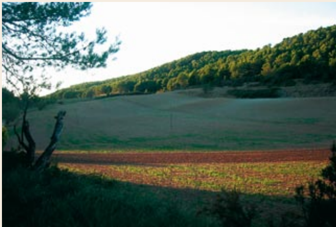
L'ampla collada de la Portella

arribar a un collet per una pista en bon estat, però una mica entollada si ha plogut de fa poc. Tot seguit baixarem pel camí més dolent fins als plans del Camp de la Bassa.