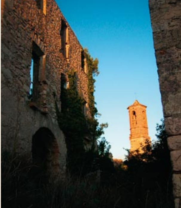
Cases i carrers abandonats de Selma

Entrarem al poble seguint les traces del corriol que, entre mig dels enderrocats de les cases, es dirigeix cap a l'església, de la qual només es conserva l'esvelt campanar. Darrere mateix agafem el sender, en direcció nord, que segueix l'antic camí de la Portella retombant a mig aire per l'obac del turó del castell. Si volem pujar a les restes del castell podem fer-ho des d'aquí, enfilant-nos a través d'alguns dels nombrosos viaranys oberts a la part de migdia del morrot. Cal fer atenció mentre caminem per entre les cases caigudes i no entrar-hi ni tocar les parets ja que tot el conjunt amenaça ruïna i pot enderrocar-se en qualsevol moment.