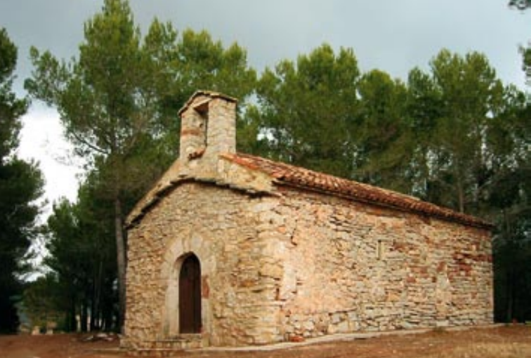
Ermita romànica de Sant Miquel