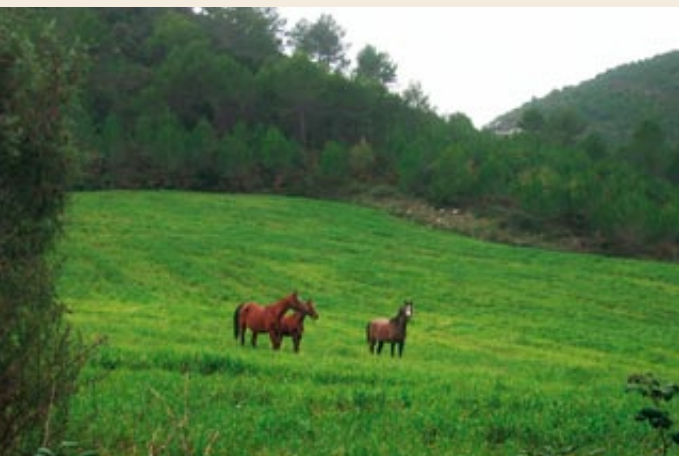
Pastures prop de la Masó de Selma

Coll de la Coma. Arribem al capdamunt de l'ampla collada, plantada de ceps, i se'ns obre al davant tota la plana