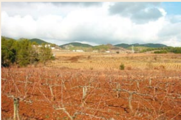
La plana del Pla de Manlleu