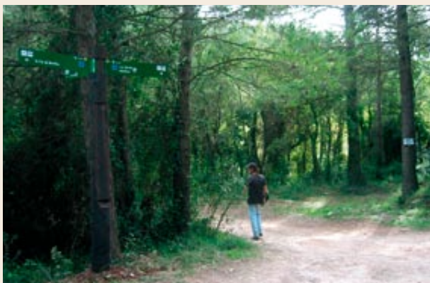
La ruta està senyalitzada amb pals indicadors

Al llarg del recorregut anirem trobant alguns senyals blancs pintats als arbres, però cal fer atenció a la descripció perquè no segueixen ben bé pel mateix camí que us proposem i, per tant, en alguns llocs els perdrem de vista. També algun cartell rònec intenta indicar la direcció de Selma.