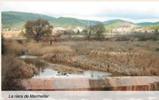
La riera de Marmellar

Enforcadura. Girem al sud-oest per la pista de l'esquerra i oblidem la de la dreta, que baixa a tocar la llera del torrent i també fa cap a cal Domingo. Entrem en un bosc de pi esclarrissat. Dos-cents cinquanta metres més endavant, en una altra bifurcació, girarem a la dreta.