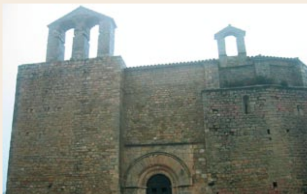
Fachada de la iglesia de Sant Jaume de Montagut

Explanada. Desde aquí parten varias pistas, básicamente destinadas a la prevención de incendios. Seguimos por la nuestra, que es mucho más ancha y transitada, siguiendo el ancho lomo de la montaña por un bosque de pinos poco tupido.